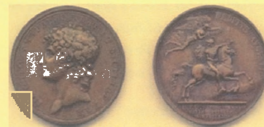
Monete di Murat