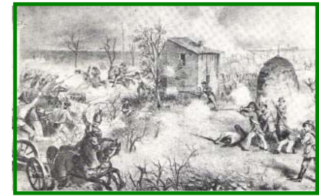
La battaglia delle Celle - Rimini 25 Marzo 1831

Associazione Mazziniana Italiana Sezione Provinciale Rimini Marzo 1831