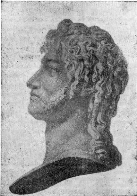
RE GIACHINO NAPOLEONE

Ma il piccolo esercito napoletano, sopraffatto dalla grande superiorità numerica delle ingenti forze austriache, è costretto a ripiegare, e Murat chiude