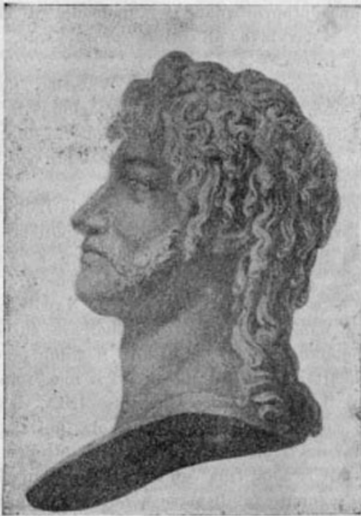
RE GIACHINO NAPOLEONE

Ma il piccolo esercito napoletano, sopraffatto dalla grande superiorità numerica delle ingenti forze austriache, è costretto a ripiegare, e Murat chiude