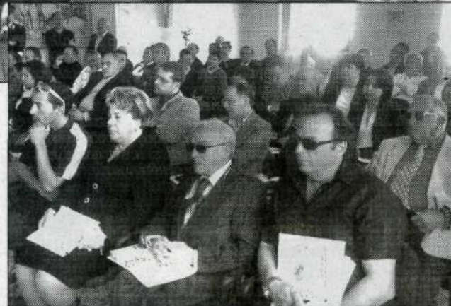
In alto le personalità presenti alla presentazione delle iniziative del bicentenario della Battaglia di Mileto. In basso il pubblico in sala