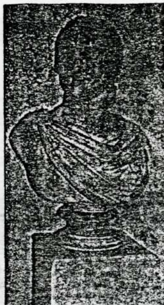
Pizzo (CZ) - Busto marmoreo, raffigurante Gioacchino Murat, che si conserva presso il Castello Murat di Pizzo